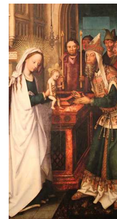
Hans Holbein d. Ältere Darstellung Christi im Tempel (Ausschnitt), Öl auf Holz, 1501