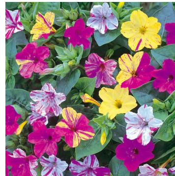
Die Wunderblume (Mirabilis jalapa)

Eine Wunderblume gibt's übrigens tatsächlich und Mirabilis, wie sie mit lateinischem Namen heißt, ist schon ein ganz besonderes Pflänzchen, auch ohne zusätzliche magische Kraft. Sie verdankt ihren Namen höchstwahrscheinlich der wundersamen Eigenschaft, verschiedenfarbige Blüten an jeder einzelnen Pflanze zu tragen. Erst am Abend entfaltet sie ihre malerische Pracht.